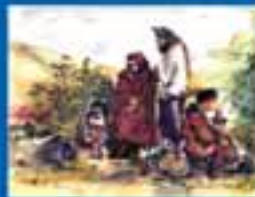
ՄԱՍՆԱԿԱՐ ԿՐԹԱԿԱՆԱԿԱՆ ԸՍՏԱՆՈՒՄ ԻՐԱՎՈՒՆՔ ԵՎ ՍԱՀՈՒ ԸՍՏԱՆՈՒՄ ԻՐԱՎՈՒՆՔ