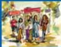
ԿՐԹԱԿԱՆԱԿԱՆ ԸՍՏԱՆՈՒՄ ԵՎ ԻՐԱՎՈՒՆՔ ԿՐԹԱԿԱՆԱԿԱՆ ԸՍՏԱՆՈՒՄ ԻՐԱՎՈՒՆՔ