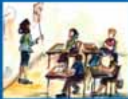
ԵՐԿՐԱՆՈՒՄԸ ԵՎ ԿՐԹՈՒՄԸ ԻՐԱՎՈՒՆՔ