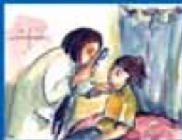
ԿՐԹԱԿԱՆԱԿԱՆ ԸՍՏԱՆՈՒՄ ԻՐԱՎՈՒՆՔ