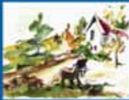
ՍԱՀՈՒ ԸՍՏԱՆՈՒՄ ԵՎ ԱՆՔՆԱԿՆԵՐՈՒՄ ԻՐԱՎՈՒՆՔ