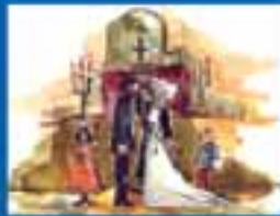
ԿՐԹԱԿԱՆԱԿԱՆ ԸՍՏԱՆՈՒՄ ԵՎ ԻՐԱՎՈՒՆՔ ԿՐԹԱԿԱՆԱԿԱՆ ԸՍՏԱՆՈՒՄ ԻՐԱՎՈՒՆՔ