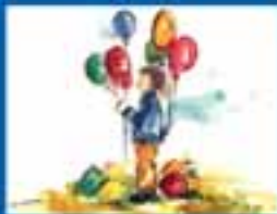
ՄԱՍՆԱԿԱՐ ԿՐԹԱԿԱՆԱԿԱՆ ԸՍՏԱՆՈՒՄ ԻՐԱՎՈՒՆՔ