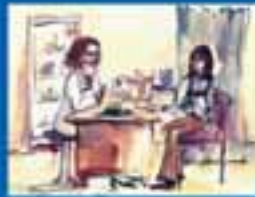
ՄԱՍՆԱԿԱՐ ԿՈՄՄՈՒՆԻԿԱԿՆԵՐՈՒՄ ԻՐԱՎՈՒՆՔ