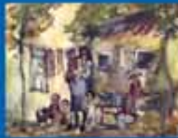
ՄԱՍՆԱԿԱՐ ԿՐԹԱԿԱՆԱԿԱՆ ԻՐԱՎՈՒՆՔ ԵՎ ՍԱՀՈՒ ԸՍՏԱՆՈՒՄ ԻՐԱՎՈՒՆՔ