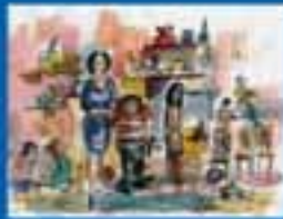
ԱՆՔՆԱԿՆԵՐՈՒՄ, ՊՐԱՎՈՒՆՔ ԵՎ ԻՐԱՎՈՒՆՔ ԸՍՏԱՆՈՒՄ ԵՎ ԿՈՄՄՈՒՆԻԿԱԿՆԵՐՈՒՄ ԻՐԱՎՈՒՆՔ